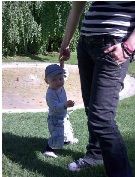
Maman de 17 ans et son fils

« L'association m'a aidée à m'en sortir lorsque je suis tombée enceinte et que j'ai eu des doutes sur les moyens que j'avais pour vivre étant en apprentissage et mon copain aussi. A l'écoute et de bon conseil, elles ont su me soutenir et m'aider lorsque j'avais des questions sur les différents formulaires à remplir. Je sais qu'à n'importe quel moment je pourrais les contacter si besoin, et qu'elles resteront toujours à mon écoute. Rencontrant des personnes qui ont vécu la maternité en étant jeunes, c'est toujours plus facile de se confier et d'écouter les conseils. »