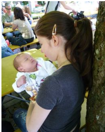
Maman de 17 ans à une rencontre

En 14 ans d'existence, les rencontres ont permis de tisser des liens et de créer de la solidarité. Fréquemment, des anciens membres de l'association reconnaissent avoir rencontré de nombreux amis par nos activités. Les jeunes parents actuels sont encore demandeurs, il n'est pas rare de perdre des amis à l'arrivée du bébé en raison du changement des préoccupations.