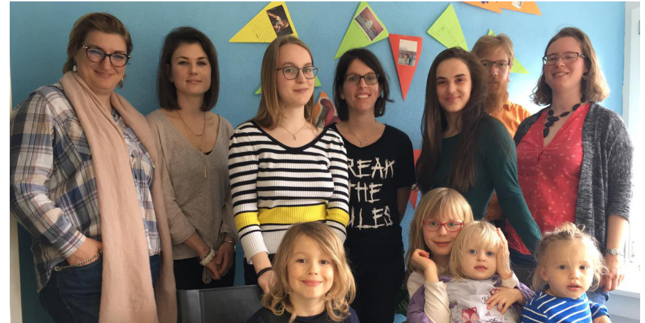
Assemblée générale du 27 avril 2019